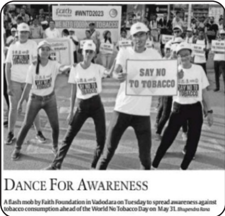
DANCE FOR AWARENESS

A flash mob by Faith Foundation in Vadodara on Tuesday to spread awareness against tobacco consumption ahead of the World No Tobacco Day on May 31.