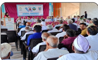
Gramsevak and Farmers workshop on the occasion of #WNTD2023 alternative crop diversification "We Need Food Not Tobacco" at Kheda, Gandhinagar, Vadodara, Anand District