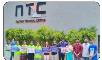
Awareness program on the occasion of "WNTD" at Neotech Institute of Technology, Vadodara