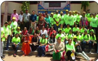
17/05/2023 Vaghasi / Mogar / Adas (Anand) / Ektannagar UPHC Vadodara