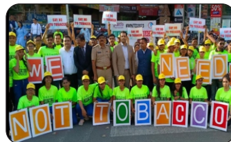
Flash Mob and Skit on the occasion of "World No Tobacco Day" Fatehgunj and Bus Depot, Vadodara