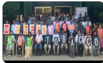
State Level Training for NTCP