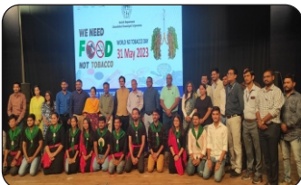
Awareness campaign on the occasion of "World No Tobacco Day" with the message of "We Need Food Not Tobacco" at Marriott Hotel, Bajaniya vas Gorwa, Sayajibaug Vadodara and Tagor Hall Ahmedabad