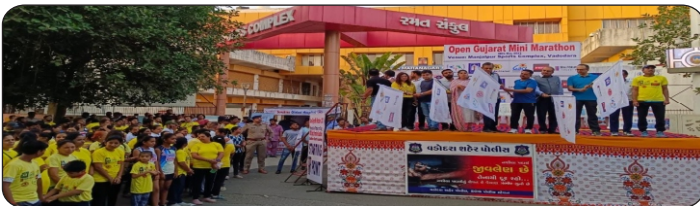
Gujarat Mini-Marathon Date 28 th May 2023