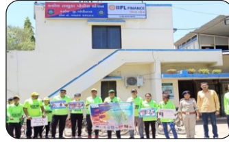
14/05/2023 Kalol /Rupal Village (Gandhinagar)