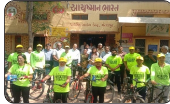
16/05/2023 Jetalpur (Ahmedabad) /Arera (Nadiad)