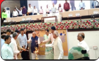
13/05/2023 Kadi /Budhasan (Mehsana)